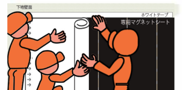
マグネットシート工法イメージ

※ご希望のFE-3WAYのサイズに合わせて必要なMG-52をお見積りいたしますので、ご用命ください。